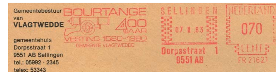
Uit welk dorp of gemeente is deze post nou afkomstig?! Op www.plaatsengids.nl staat het allemaal uitlegd.

Gemeenten zouden zichzelf makkelijk kunnen promoten met een paar honderd euro aan plaatsnaambordjes. Wat te denken van het buurtschap Paradijs? Wie er gaat